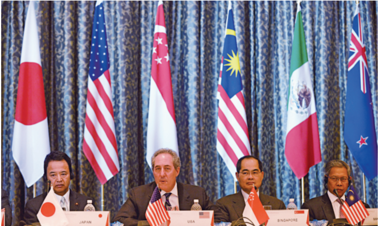
目前亞太地區正醞釀簽署兩個多邊自由貿易協定，一是跨太平洋夥伴協定（TPP），二為區域全面經濟夥伴協定（RCEP）。圖為美國、馬來西亞、新加坡和日本4國代表出席TPP部長級會議。

要是由美國主導，包括：加拿大、墨西哥、智利、秘魯等橫跨美、亞、澳三大洲共12個國家簽署；其中，日本、澳洲、紐西蘭、汶萊、馬來西亞、新加坡、越南等7國，也有加入RCEP的組織。至於RCEP則是以東協國家為主，除前述日本等7國，尚包含中國大陸、韓國、印度、印尼、菲律賓、泰國、柬埔寨、寮國及緬甸。