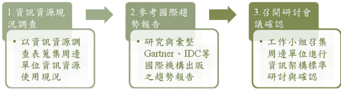
圖 1 訂定資訊架構標準步驟