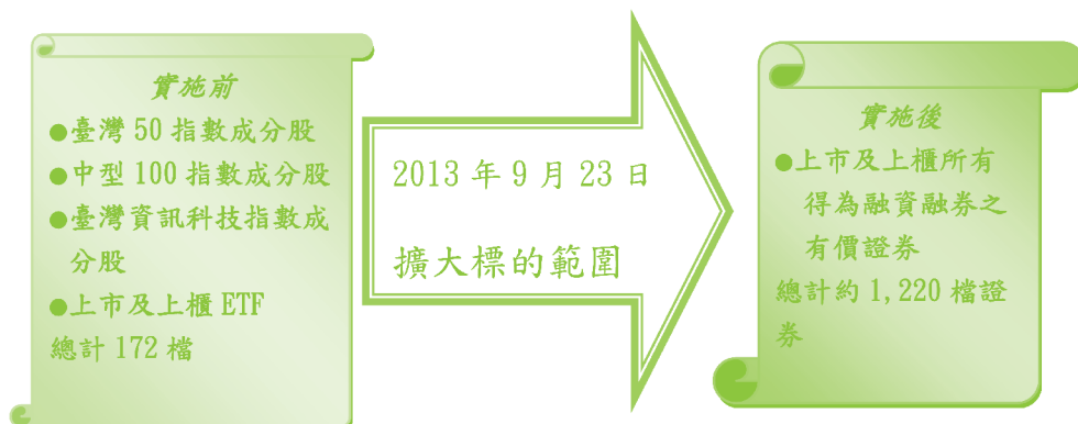
圖二：新制度實施前後平盤下可融（借）券賣出標的比較圖

金管會在參酌國外機制後，於新制度實施時，訂有配套措施，簡稱「冷卻機制」，即當標的證券當日收盤價為跌停時，次一交易日將被暫停平盤以下融券及借券賣出，再次一交易日恢復平盤以下融券及借券賣出。制訂此項配套措施係考量當一檔證券之收盤價格為跌停時，無論是因市場之系統性因素或為個別發行公司財務業務之負面消息所引起，對市場而言均屬利空訊息，暫停一天之平盤下融（借）券賣出，可以讓市場資訊充分流通，並使投資人具較多時間消化、判斷市場的資訊，以減少標的證券價格受到非理性賣壓的衝擊。但「冷卻機制」訂有兩種豁免情況，一為 ETF 不受限制，另一種情況為證券商及期貨商如有辦理業務之避險需求，例如發行權證或選擇權造市之避險交易等，所從事之融券及借券賣出交易，亦不會受冷卻機制的限制。